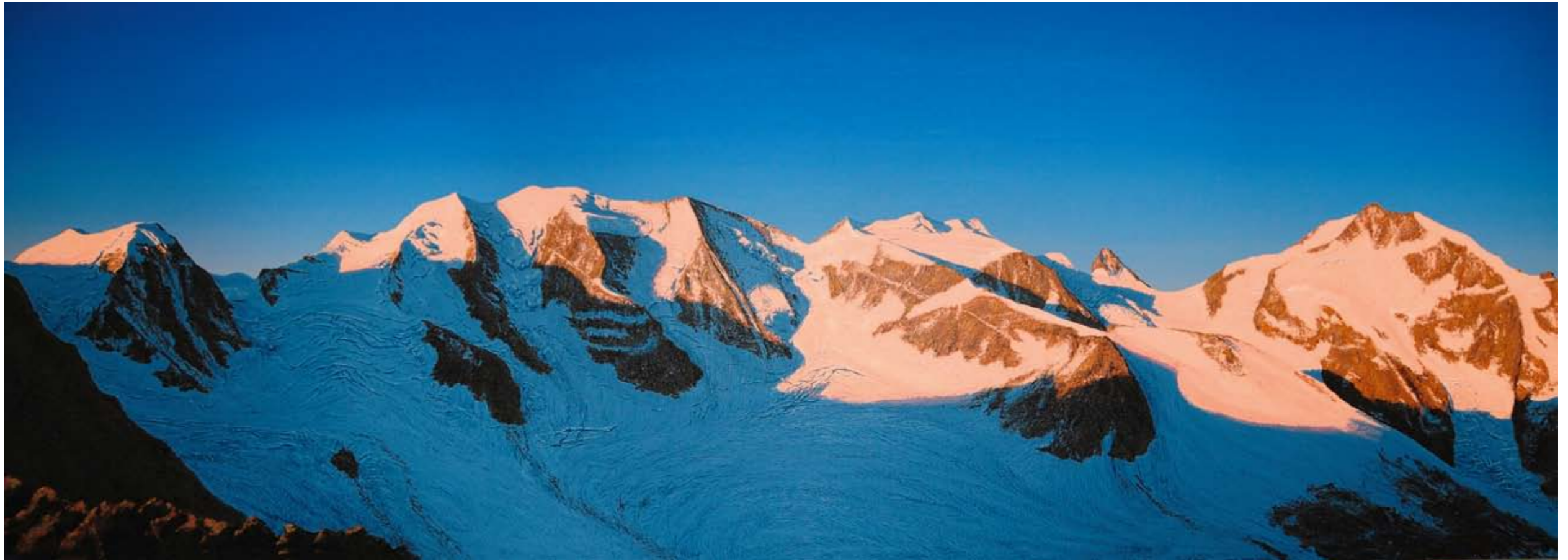
„Morgenpanorama auf der Diavolezza“ Öl auf Leinwand, 80x220cm