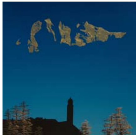
„Impression: Soglio“ Blattgold und Broncepuder auf Leinwand, 100x100 cm