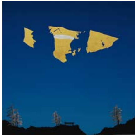
„Impression: Piz Palü am Abend“ Alkydharz, Blattgold und Broncepuder auf Leinwand, 100x100 cm