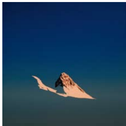
„Momentum: Crast' Agüzza“ Alkydharz auf Leinwand, 100x100 cm